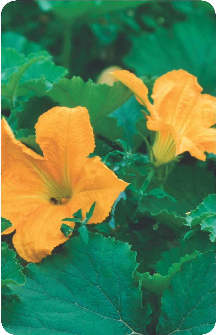
6 El jardín tiene flores.