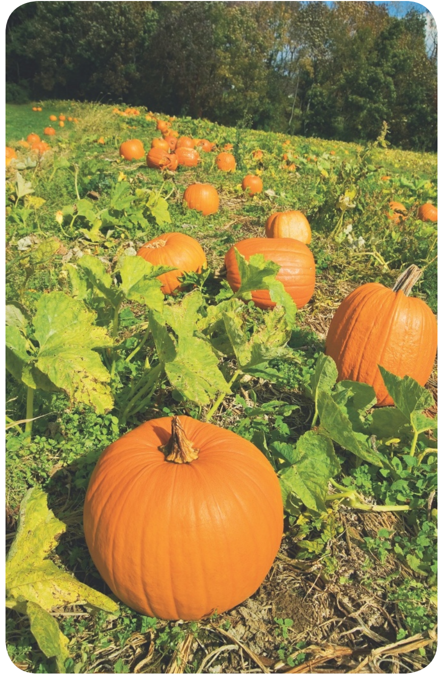
7 El jardín tiene calabazas.